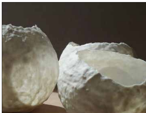
Collection lumière, photophores en porcelaine papier © Patricia Masson