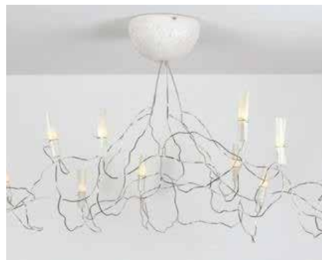
Lustre Sauvageon © Véro & Didou