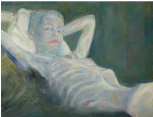
Nous ne sommes définitivement pas les derniers Huile sur toile, 50 x 65 cm © Franck Leviski

Les amis du jardin d'hélys | 05 53 52 78 78