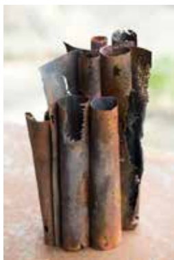
Connexion, émail sur métal