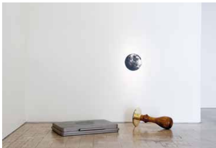
Robin Rhode, Untitled (Moon Stamp + Ink Pad), 2012

*Southern African Foundation For Contemporary Art, créée en 2014 à Johannesburg, avec pour principaux objectifs : partager l'art par amour et par passion, encadrer, soutenir et promouvoir l'art et les artistes contemporains d'Afrique australe, participer à l'inclusion de l'art contemporain du sud du continent africain dans la globalité artistique contemporaine.