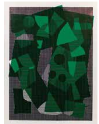
Fantôme, 2016, encre et adhésif sur papier, 60 x 80 cm © Jean-Marie Blanchet