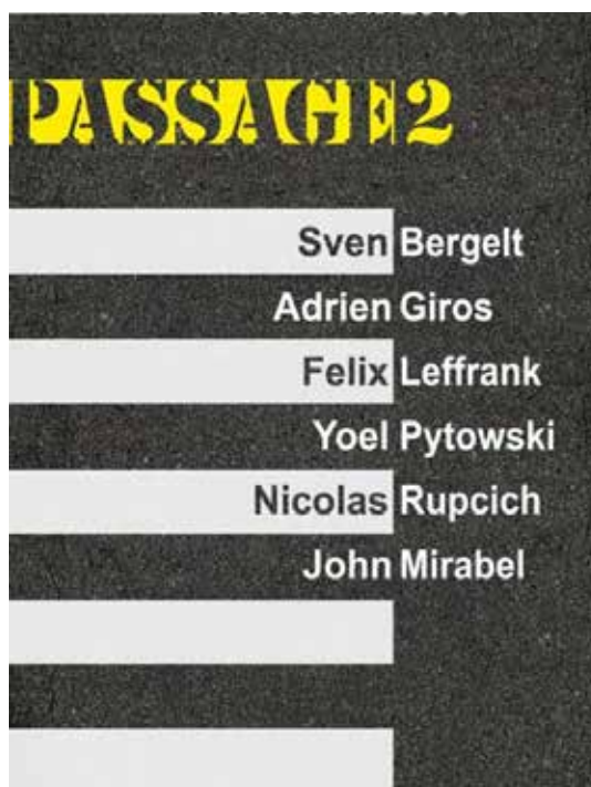
Passage #2 / Conception graphique Audrey Tröndle

Association La Nouvelle Galerie | 06 80 06 69 23