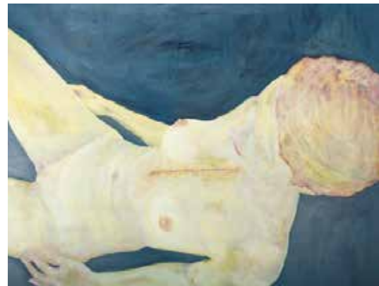
Nous ne sommes définitivement pas les derniers Huile et pigments sur toile, 97 x 130 cm © Franck Leviski