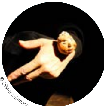
© Olivier Lehmann et Nicolas Tavernier

Samedi 19 mai 14h30 et 16h15 Salle Eugène Le Roy